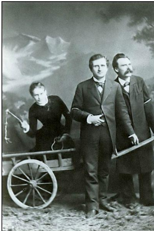
Lou Salome, Paul Ree, Friedrich Nietzsche